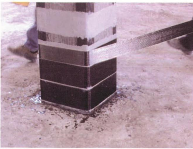
Posa in opera della fasciatura