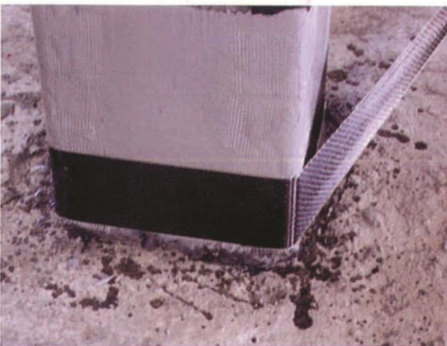
Posa in opera della fasciatura

pilastri in cemento armato secondo le seguenti tipologie di intervento: