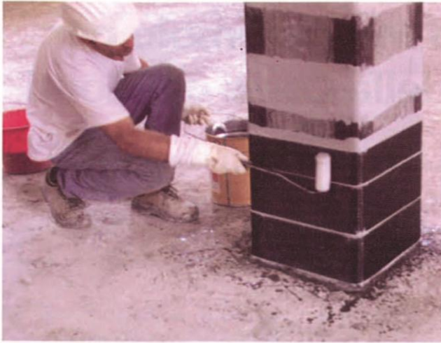
Posa in opera della fasciatura